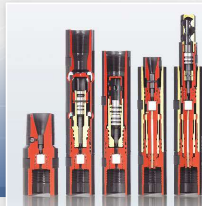
ГОЛОВКИ СТРЕЛЯЮЩИЕ ORION