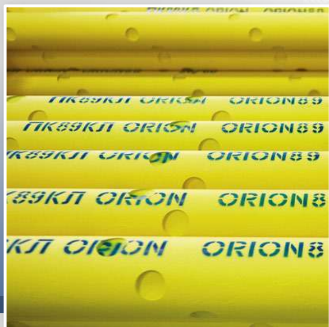
ПЕРФОРАЦИОННЫЕ СИСТЕМЫ ORION