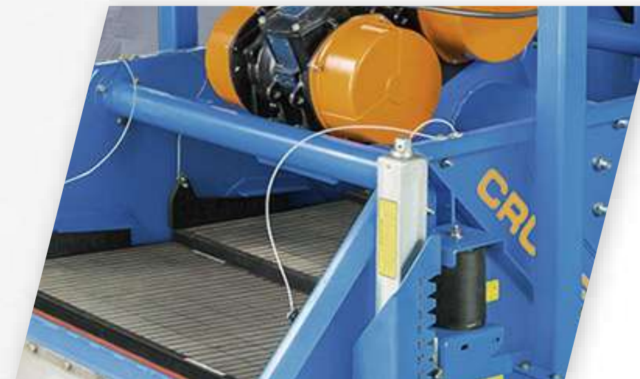
СПЕЦИАЛЬНАЯ ТЕХНИКА И ОБОРУДОВАНИЕ ЦИРКУЛЯЦИОННЫХ СИСТЕМ