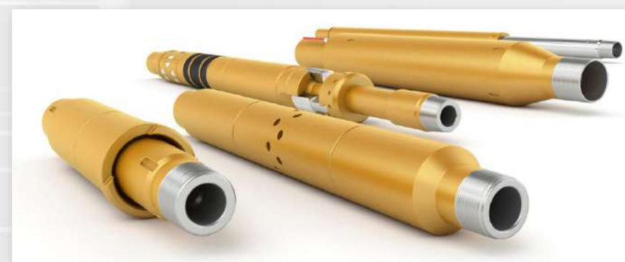
КОМПЛЕКСЫ ПОДЗЕМНОГО ОБОРУДОВАНИЯ, КЛАПАНЫ И СКВАЖИННАЯ ОСНАСТКА