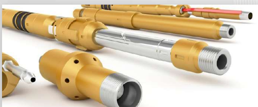
ОБОРУДОВАНИЕ И КОМПОНОВКИ ДЛЯ ПРОВЕДЕНИЯ ГИДРОРАЗРЫВА ПЛАСТА