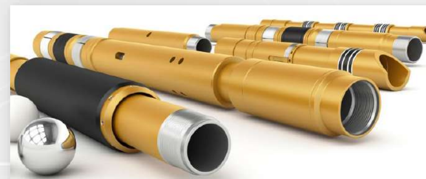
ОБОРУДОВАНИЕ ДЛЯ ГАЗОВЫХ И ГАЗОКОНДЕНСАТНЫХ СКВАЖИН